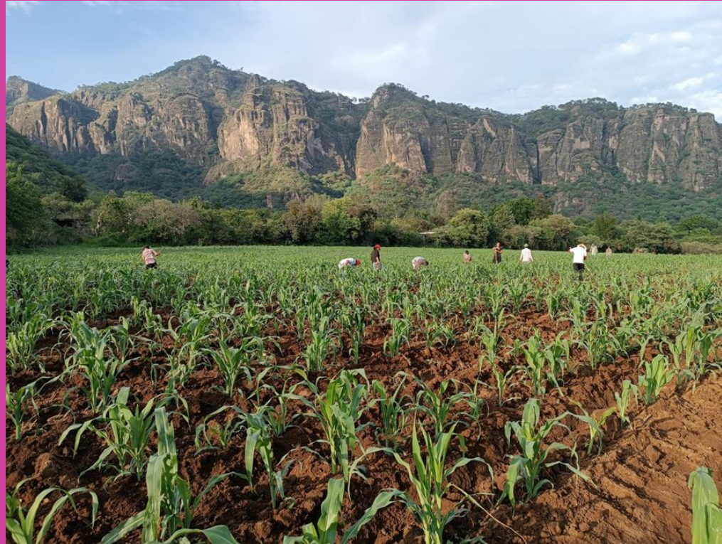
Vista a los cerros de San Gerónimo desde el terreno del Santo. Julio 2023.